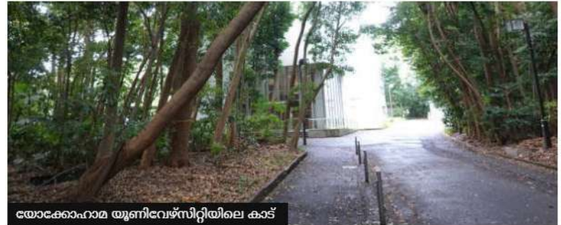
യോക്കോഹാമ യൂണിവേഴ്സിറ്റിയിലെ കാട്

പ്രൊഫ. മിയാവാക്കി വികസിപ്പിച്ചെടുത്ത നവ വനവൽക്കരണ മാതൃക ഇന്ന് ലോക പ്രസിദ്ധമാണ്. 1970 ലാണ് ഈ മാതൃക ആദ്യം അവതരിപ്പിക്കുന്നത്. 1972 ൽ നിപ്പോൺ സ്റ്റീൽ കമ്പനിയിൽ ഇത് പ്രയോഗത്തിലെത്തി. നാലു പതിറ്റാണ്ട് പിന്നിട്ട ഇത്തരം ചെറുവനങ്ങൾ ഇപ്പോൾ യോക്കോഹാമ യൂണിവേഴ്സിറ്റിയുടെ ക്യാമ്പസ്സിനെ ഹരിതാഭമാക്കുന്നു. 1976ലാണ് ക്യാമ്പസ്സിൽ മരങ്ങൾ നട്ടുതുടങ്ങുന്നത്. യോക്കോഹോമ യൂണിവേഴ്സിറ്റിയുടെ മറ്റൊരു പ്രത്യേകത യാതൊരു നിയന്ത്രണവുമില്ലാതെ സ്വതന്ത്രമായി ആർക്കും സന്ദർശിക്കാവുന്ന ലോകത്തിലെ അപൂർവ്വം ക്യാമ്പസ്സുകളിലൊന്നാണിത്. 1990കളിൽ, നമ്മുടെ ജെ. എൻ. യുവും മറ്റും ഇങ്ങനെയായിരുന്നു എന്നോർക്കണം.