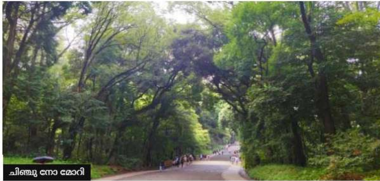
ചിഞ്ചു നോ മോറി