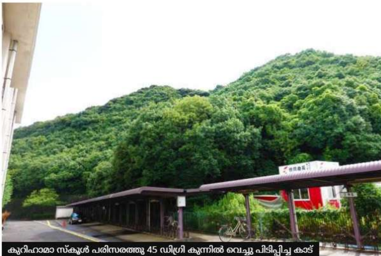
കുറിഹാമാ സ്കൂൾ പരിസരത്തു 45 ഡിഗ്രി കുന്നിൽ വെച്ചു പിടീപ്പിച്ച കാട്