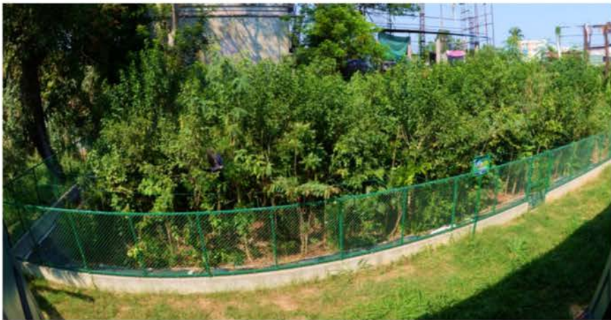
തിരുവനന്തപുരം ചാല ജില്ലയിലെ എസ്.എസ്.ഐ.ഒ. ഒരു വർഷം പൂർത്തിയാക്കുന്ന മിയാവാക്കി വനം.

ശുദ്ധവായു, എത്രയോ പക്ഷിമൃഗാദികൾക്കു വാസസ്ഥാനം, വംശനാശ ഭീഷണി നേരിടുന്ന എത്രയോ സസ്യജാലങ്ങൾക്കു വേരുറപ്പിക്കാൻ ഇടം, ആഗോള താപനത്തിനു പരിഹാരം- ഒരു കാടിന്റെ ധർമ്മമെല്ലാം ഈ കുട്ടിക്കാടുകളും നിറവേറ്റും. പിന്നീടു ബോധ്യപ്പെട്ടു നടപ്പാക്കിയതാണു സുനാമി പ്രതിരോധം. ജപ്പാൻ ഉൾപ്പെടെ രാജ്യങ്ങളിൽ കൂതിച്ചുയരുന്ന തിരമാലകളെ ചെറുക്കാനും ഇപ്പോൾ മിയാവാക്കി കാടുകൾ ഉപയോഗിക്കുന്നു. വളരെ ഉയരത്തിലുള്ള ഈ വനം, സുനാമി തിരമാലകളെ ചെറുക്കും. ശക്തി ചേർന്ന, ഉയരം കുറഞ്ഞ അലകളാകും ഈ വനങ്ങളെയും പിന്നീടു കരയിലെത്തുക. വീണ്ടും കടലിലേക്കു പിൻവാങ്ങുന്ന തിരകൾ അടർത്തിക്കൊണ്ടു പോകുന്ന ജീവനുകളും ഭൗതിക സമ്പാദ്യങ്ങളും അരിപ്പ പോലെ ഈ വനങ്ങൾ തടഞ്ഞു നിർത്തുകയും ചെയ്യും.